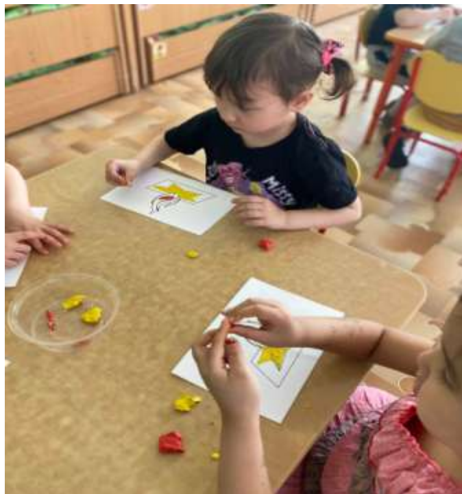
Лепка на тему «Вечный огонь»

и там, и тут! Над площадью, над крышами, (Присесть, встать, руки с раскрытыми пальчиками поднять вверх 2—3 раза) Над праздничной Москвой Взвивается все выше Огней фонтан живой. На улицу, на улицу (Легкий бег на месте). Все радостно бегут, Кричат: «Ура! », (Поднять руки вверх, крикнуть «Ура» ). Любуются (Раскрыть пальчики веером, помахать руками над головой влево-вправо) На праздничный салют!